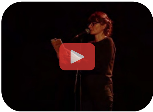
Lecture-performance Rouge Pute