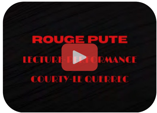
Lecture-performance Rouge Pute